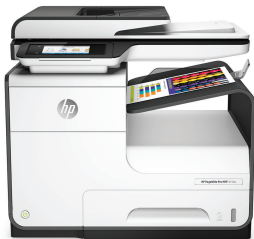
Impresora Multifunción HP PageWide Pro 477dw

Lo mejor en rentabilidad y velocidad: la impresora HP PageWide Pro brinda el costo total de propiedad más bajo y las velocidades más rápidas en su clase. 1,2 Obtenga un rápido escaneo a doble cara además de los mejores recursos de seguridad y eficiencia de consumo de energía en su clase. 3,4