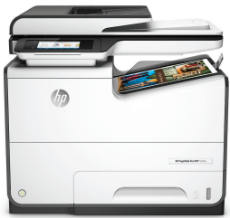
Impresora Multifunción HP PageWide Pro 577dw